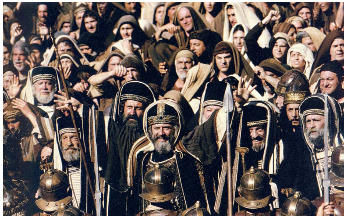
Кадр из кинофильма «Страсти Христовы»